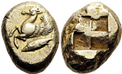
Los Nr. 193 GRIECHEN. MYSIEN. KYZIKOS. Stater. 550 - 450 v. Chr. Verkauft: 11.250 EUR