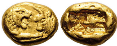
Los Nr. 235 GRIECHEN. KÖNIGREICH LYDIEN. Kroisos, 561 - 546 v. Chr. Trite. Verkauft: 10.000 EUR