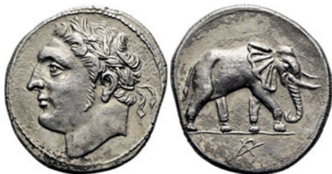
Los Nr. 344 GRIECHEN. ZEUGITANIA. KARTHAGO. Schekel. 213 - 210 v. Chr. Verkauft: 16.250 EUR