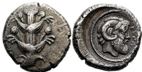
Los Nr. 338 GRIECHEN. KYRENAIKA. KYRENE. Tetradrachme. 480 - 435 v. Chr. Verkauft: 13.750 EUR