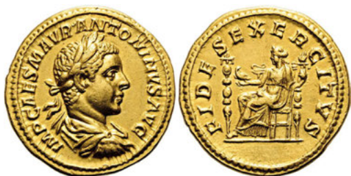
Los Nr. 465 RÖMER. RÖMISCHE KAISERZEIT. Elagabal, 218 - 222 n. Chr. Aureus. 218 - 219 n. Chr. Verkauft: 21.250 EUR