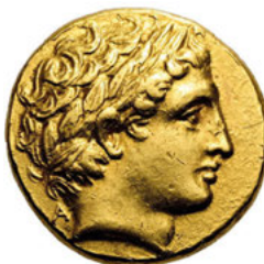
Los Nr. 116 GRIECHEN. MAKEDONISCHE KÖNIGE. Philipp II., 359 - 336 v. Chr. Stater. 332 - 315 v. Chr. Verkauf: 10.000 EUR