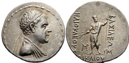
Los Nr. 321 GRIECHEN. KÖNIGREICH BAKTRIEN. Heliokles I. Dikaios, ca. 145 - 130 v. Chr. Tetradrachme. Verkauft: 8.125 EUR