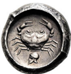
Los Nr. 50 GRIECHEN. SIZILIEN. AKRAGAS. Didrachme. 488/5 - 480/78 v. Chr. Verkauf: 13.750 EUR