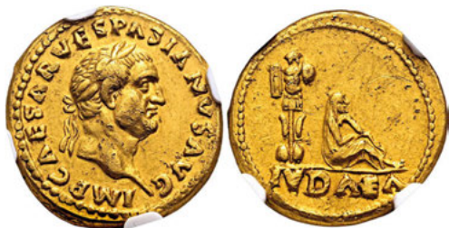
Los Nr. 424 RÖMER. RÖMISCHE KAISERZEIT. Vespasian, 69 - 79 n. Chr. Aureus. 69 - 70 v. Chr. Verkauft: 41.250 EUR