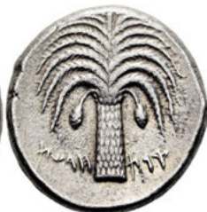
Los Nr. 76 GRIECHEN. SIZILIEN. SIKELOPUNIER. Karthago. Tetradrachme. 410 - 390 v. Chr. Verkauf: 21.250 EUR