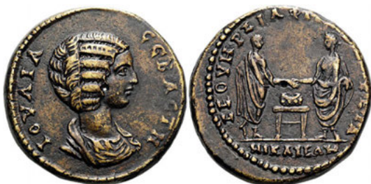
Los Nr. 1123 RÖMISCHE PROVINZIALPRÄGUNGEN. BITHYNIEN. NIKAIA. Iulia Domna, 193 - 217 n. Chr. Tetrassarion. 202 - 205 n. Chr. Verkauft: 2.750 EUR

GM 1970 GORNY & MOSCH GIESSENER MÜNZHANDLUNG GMBH