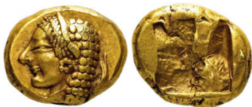
Los Nr. 211 GRIECHEN. IONIEN. PHOKAIA. Hekte. 521 - 478 v. Chr. Verkauft: 10.000 EUR