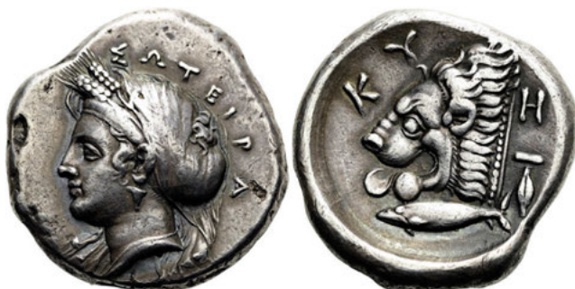
Los Nr. 195 GRIECHEN. MYSIEN. KYZIKOS. Tetradrachme. 350 - 300 v. Chr. Verkauft: 10.000 EUR