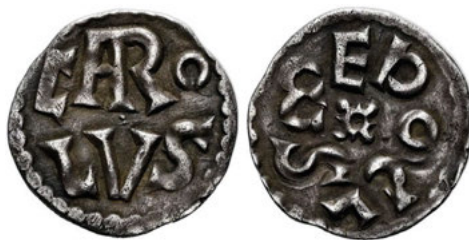
Los Nr. 2001 MITTELALTER DEUTSCHLAND. KAROLIN- GER. Karl der Große, 768 - 814. Denar o.J. (771 - 793), Melle. Verkauft: 3.000 EUR

Ausgesuchte Münzen und Medaillen aus Mittelalter und Neuzeit Mittelalter, Abteischulden sowie Deutschland ab 1871, Öst. Österreich-deutsche Kaiser, Öst. Schiffe und Seefahrtswesen, Habsburgische Länder, Europa und Übersee