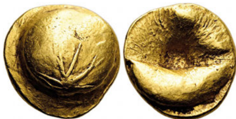
Los Nr. 13 KELTEN. BÖHMEN UND SLOWAKEI. BOIER. Muscheltyp. Stater. Spätes 2. - frühes 1. Jh. v. Chr. Verkauf: 6.875 EUR*