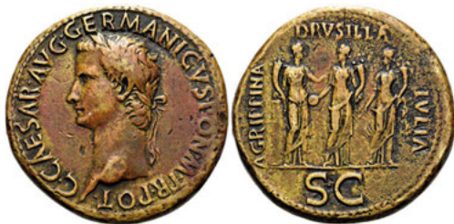
Los Nr. 412 RÖMER. RÖMISCHE KAISERZEIT. Caligula, 37 - 41 n. Chr. Sesterz. 37 - 38 n. Chr. Verkauft: 10.000 EUR