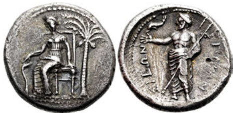
Los Nr. 188 GRIECHEN. KRETA. PRIANSOS. Stater. 4. Jh. v. Chr. Verkauft: 13.750 EUR