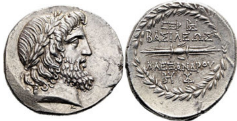
Los Nr. 270 GRIECHEN. NÖRDLICHE LEVANTE. SELEUKIDEN. Alexander I. Theopator Euergetes, 150 - 145 v. Chr. Tetradrachme. 147 - 146 v. Chr. Verkauft: 27.500 EUR