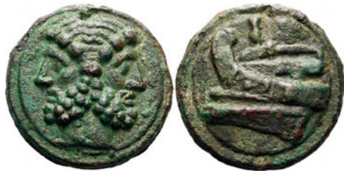
Los Nr. 366 RÖMER. RÖMISCHE REPUBLIK. AES GRAVE. Anonym, 240 - 225 v. Chr. As. Verkauft: 6.250 EUR