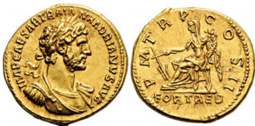
Los Nr. 434 RÖMER. RÖMISCHE KAISERZEIT. Hadrian, 117 - 138 n. Chr. Aureus. 118 n. Chr. Verkauft: 16.250 EUR